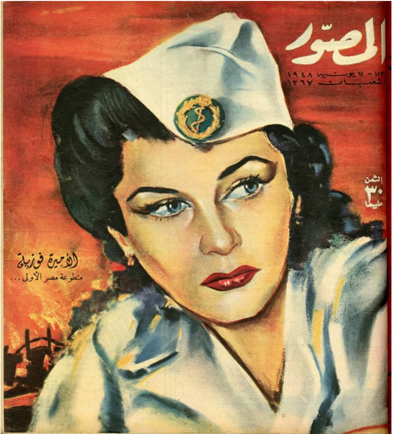
PL.5: A portrait of Princess Fawzia as a volunteering nurse during Palestine's war 1948 120 .