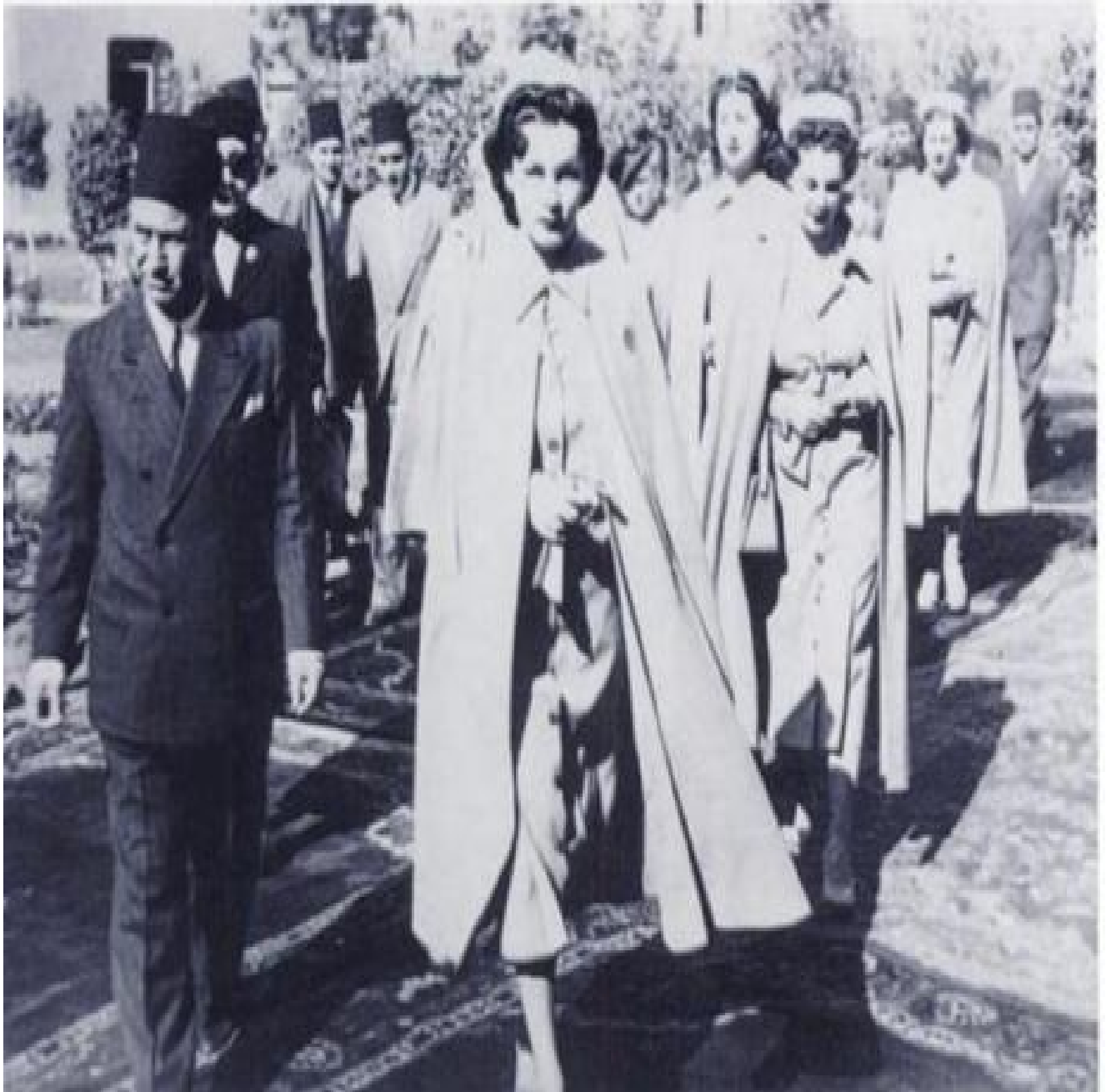
PL.4: Princess Fawzia with her sister Princess Faiza wearing the Red Crescent Uniform. 125