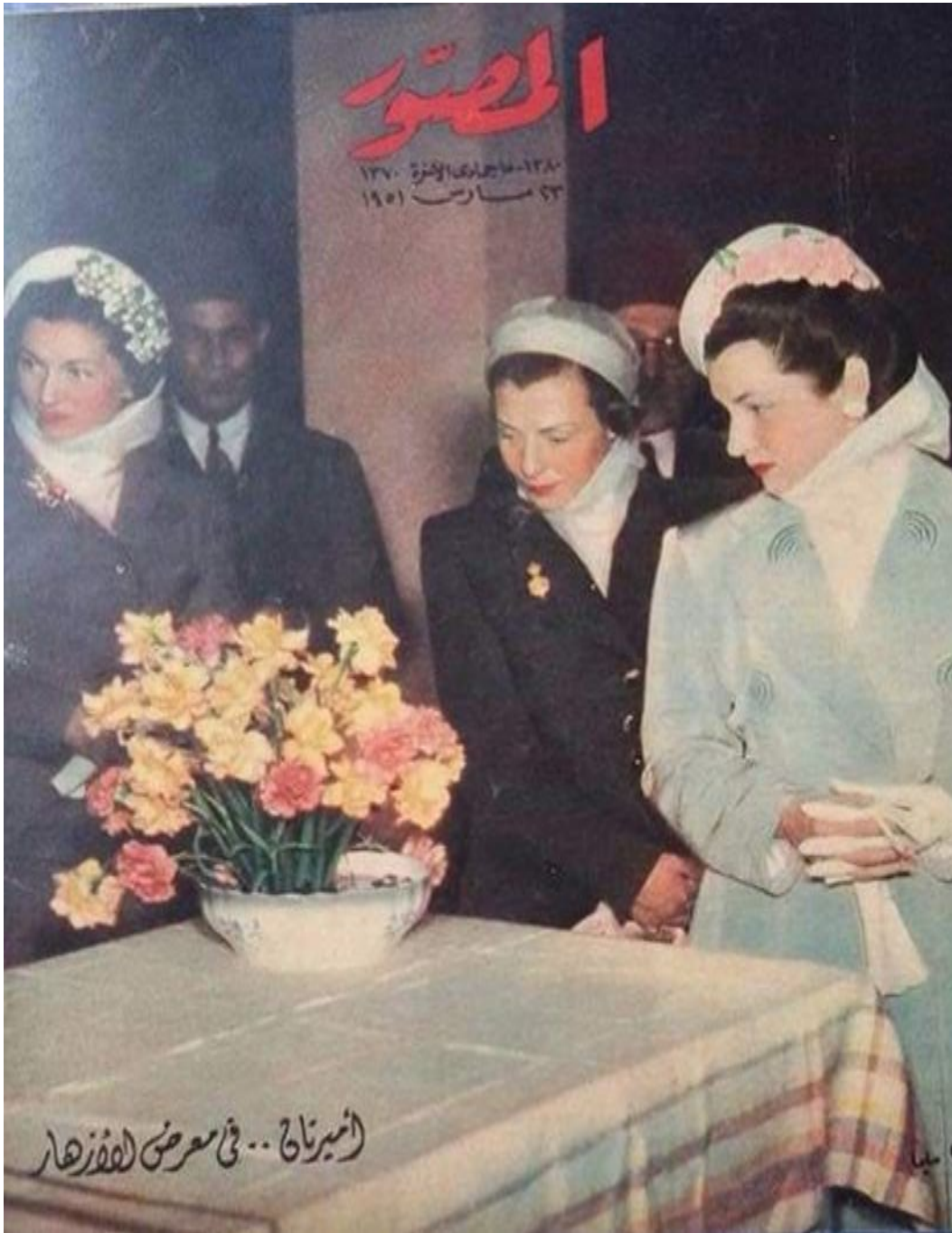
PL.2: A portrait of princess fawzia while taking part in the annual flowers' exhibition 123 .