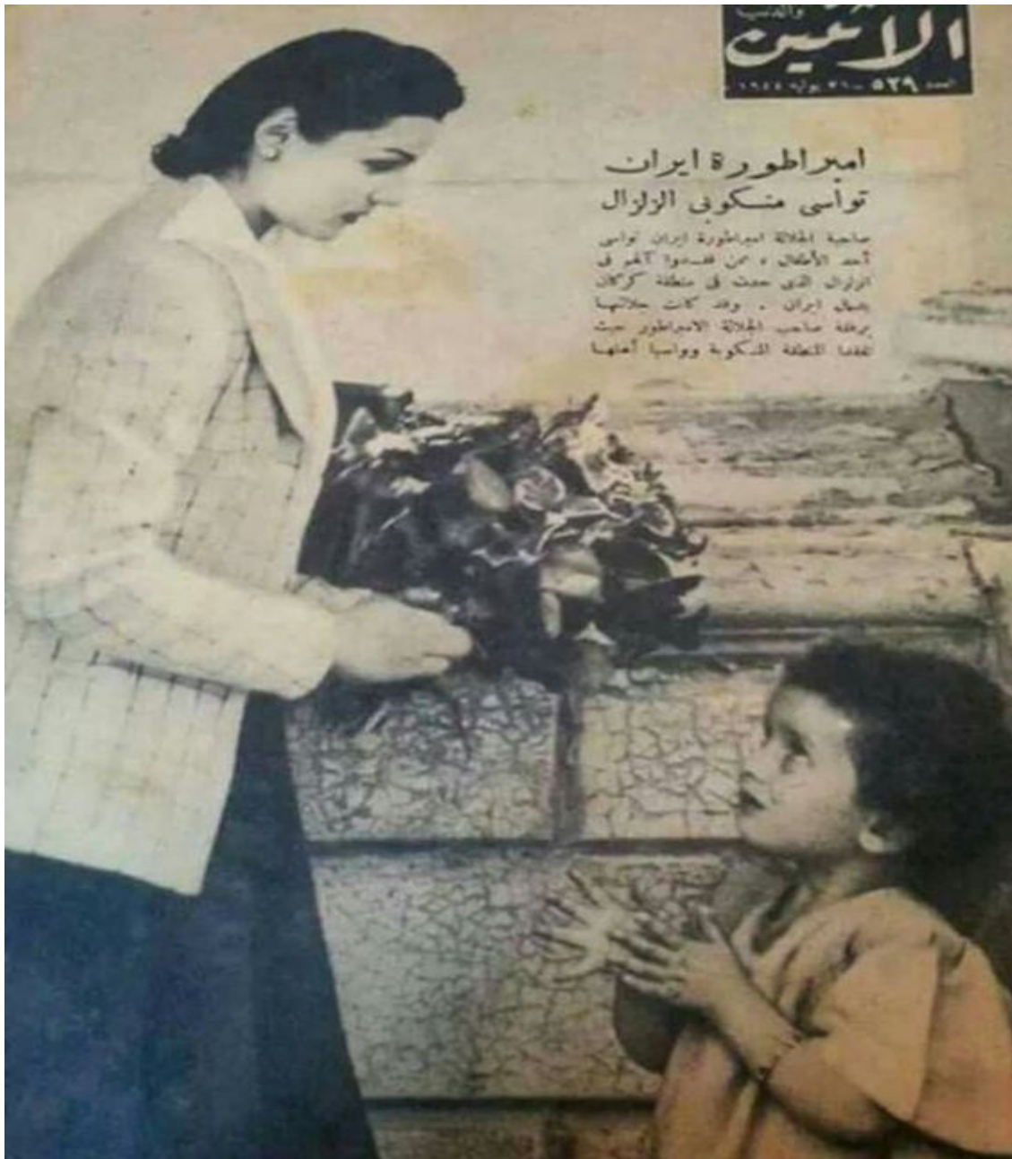
PL.1: Empress fawzia participate in charity activities in Iran 122 .