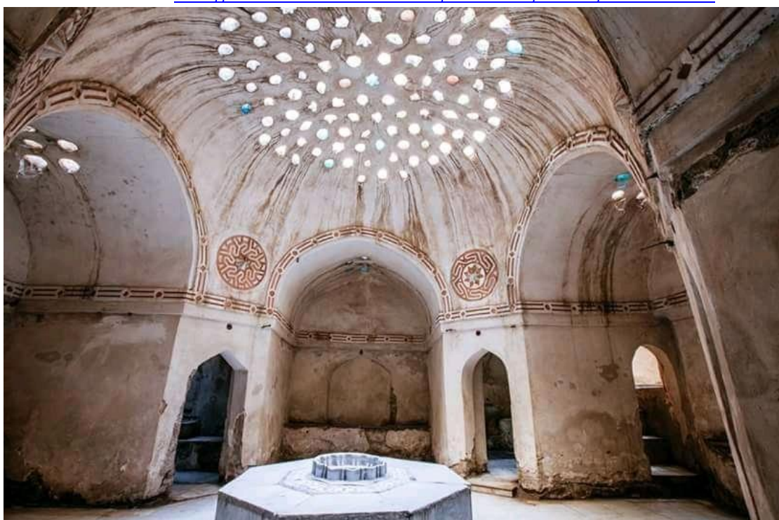
لوحة رقم (6) حمام عزوز

http://www.antiquities.gov.eg/DefaultAr/Pages/default.aspx