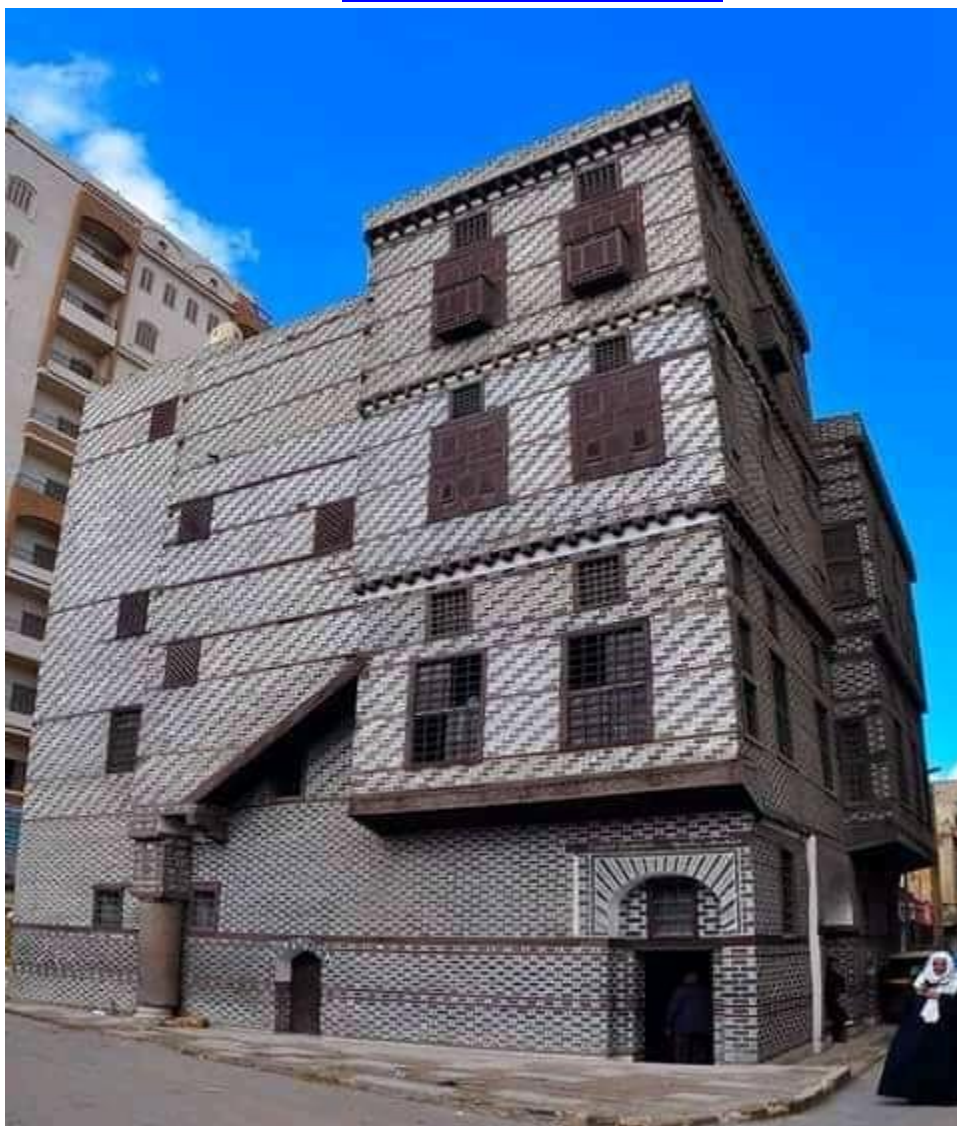
لوحة رقم (4) منزل عرب كلي

نقلا عن الموقع الرسمي لوزارة السياحة والآثار، تم الرجوع إليه في 30 أكتوبر. 2022