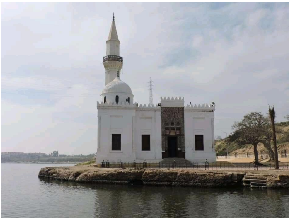
لوحة رقم (٣) مسجد أبو مندور