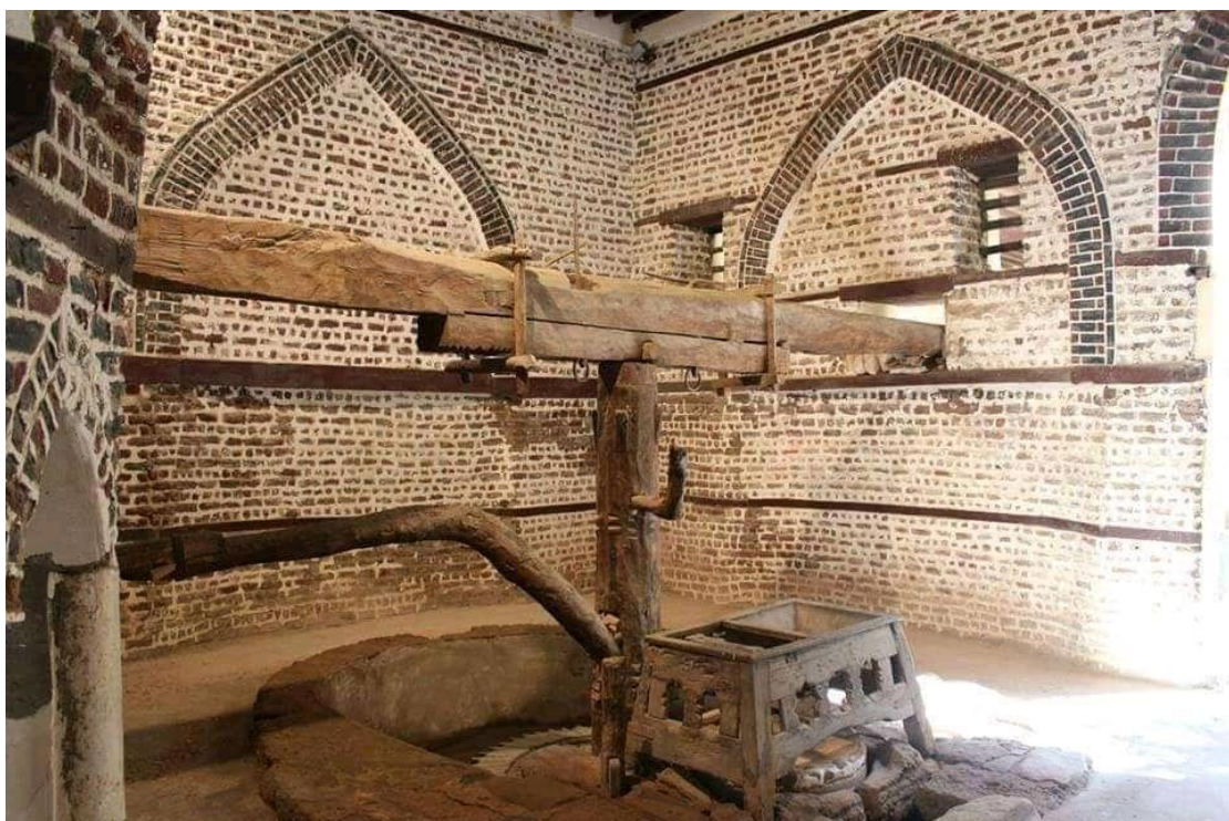
لوحة رقم ( 5 ) طاحونة أبو شاهين